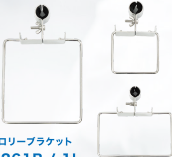
トロリーブラケット 4261B / 1L 4247B / 2L 4240B / 4L.7L 兼用