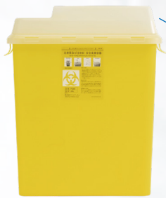
26L 大量の廃棄物処理が可能