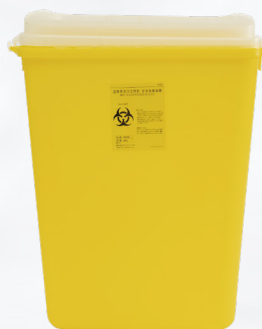
50L 大量の廃棄物処理が可能