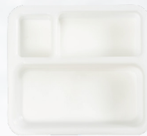
1L / 2L / 3L トレイ TR123