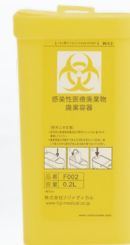
0.2L 携帯性に優れた設計