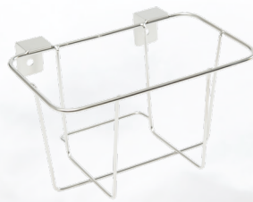
ワゴンブラケット 4402 / 2L.3L 兼用