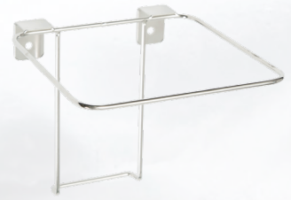
ワゴンブラケット 4403 / 4L.7L 兼用