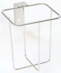
ワゴンブラケット 4401 / 1L