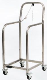
50Lトロリーブラケット TY50