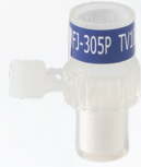
FJ-305P [新生児・ポート付]