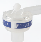
FJ-3215 [成人 S]