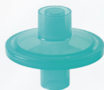
FJ-2160 静電気フィルター ベーシック